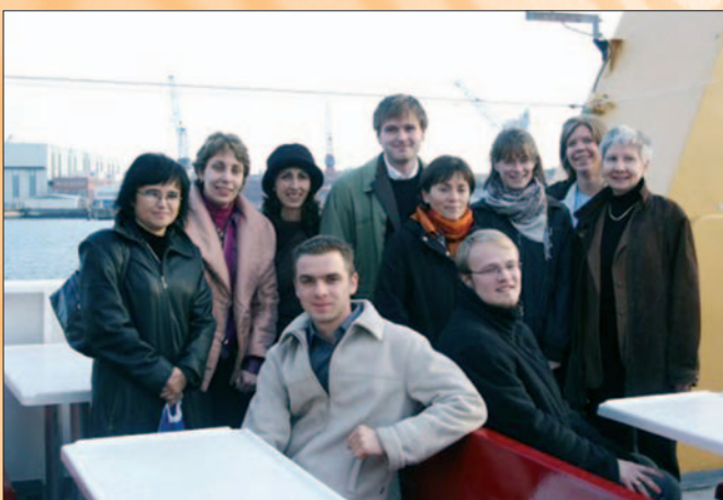
▲ Eine Dampferfahrt auf der Kieler Förde zur aktiven Erholung.

Gestaltung und Konzept conrat – agentur für marketing und kommunikation Auflage: 250 Verantwortlich: schiff-gmbH Redaktion: md@conrat.org Bildnachweis: BQM; C. Breitmfelder; conrat; Development Partnership NAFALI - On the Wave; Wojciech Kreft; IBAF Die Verantwortung für die Inhalte liegt bei der Autorin / bei dem Autor des jeweiligen Beitrags.